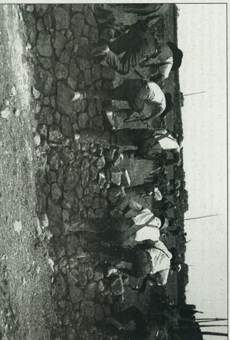
Milicianos saltan un parapeto en el frente de Teruel en un municipio sin identificar

'Viviendo la utopía' puede verse en la residencia internado Santa Emerenciana hasta el próximo 16 de febrero.