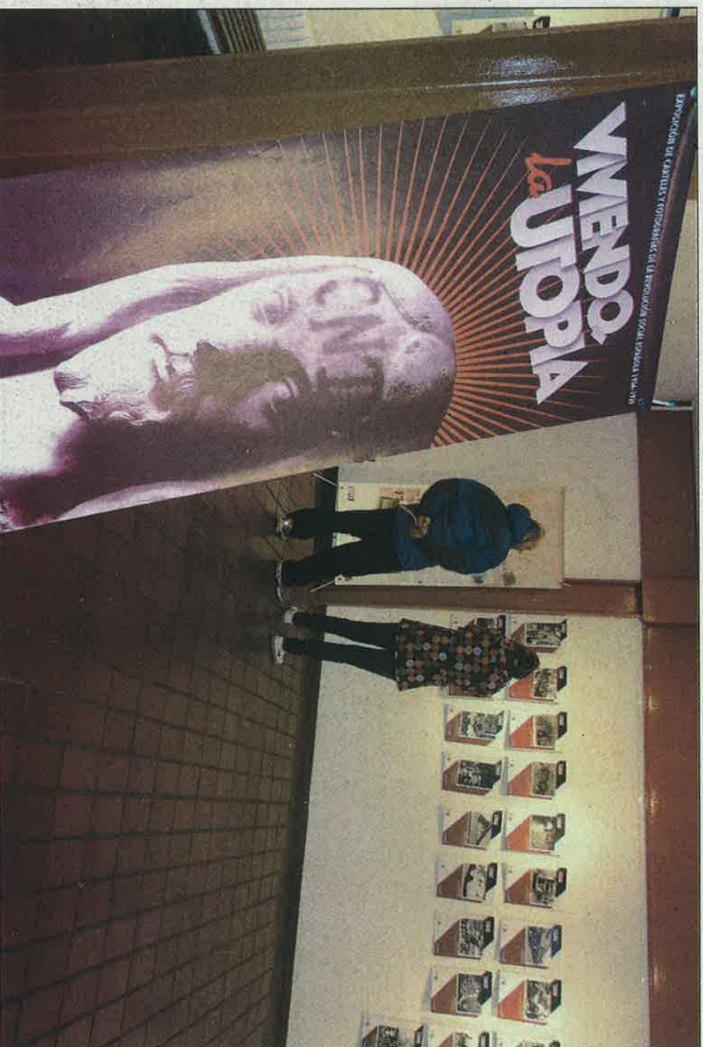
Dos personas visitan la exposición en la residencia internado Santa Emerenciana

El primer bloque introduce al visitante en lo que sucedió hace más de 70 años cuando se libró una batalla entre la libertad y el poder, que fijó las miradas de todo el mundo en España.