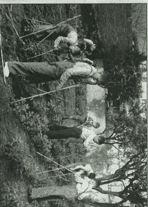
Iglesia de Aragón no identificada convertida en almacén. Camino del exilio y niños en la granja escuela Sebastián Faure